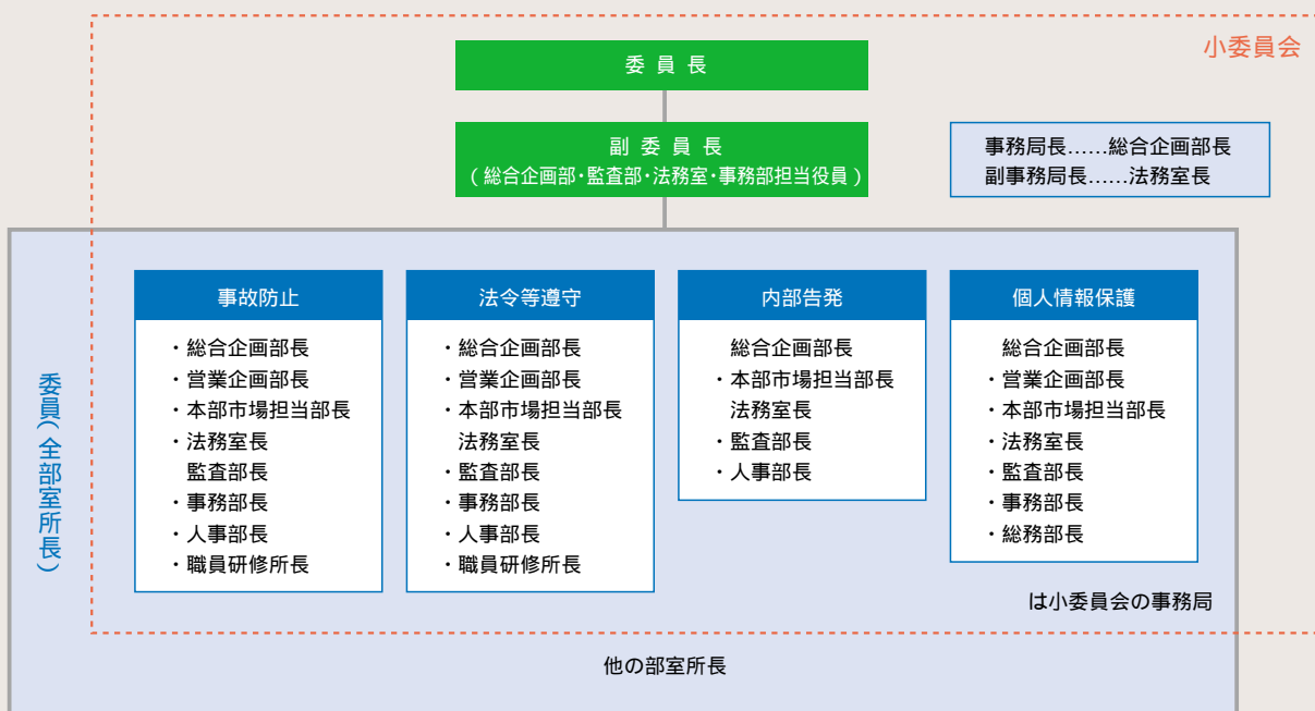
コンプライアンス委員会組織図

ついて解説した「法令遵守の手引き」を全行員へ配布し、常に手元において行動の指針とするとともに、毎年策定するコンプライアンス実践計画に基づく研修等を通じて、法務知識の向上と遵法精神の徹底に努めています。