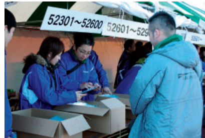
ぐんま県民マラソン

また、各種募金や、障害者施設で作成するカレンダーを購入するなどの資金面での援助も行っています。