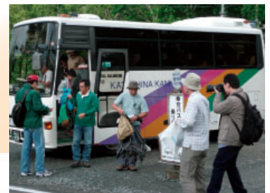
オリジナルのゴミ袋を配布しゴミの持ち帰りを呼びかける

環境保全や森林資源保護といった観点から、尾瀬の美しい自然を守っていくために、行員の自主的な活動として「尾瀬のゴミ持ち帰り運動」を、平成2年から継続的に実施しています。尾瀬の入山者に、当行が作ったオリジナルのゴミ袋を配布しゴミの持ち帰りや自然保護を呼びかけるとともに、自らも進んで清掃活動などを行っています。