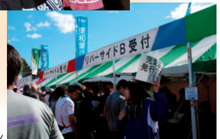
ぐんま県民マラソン